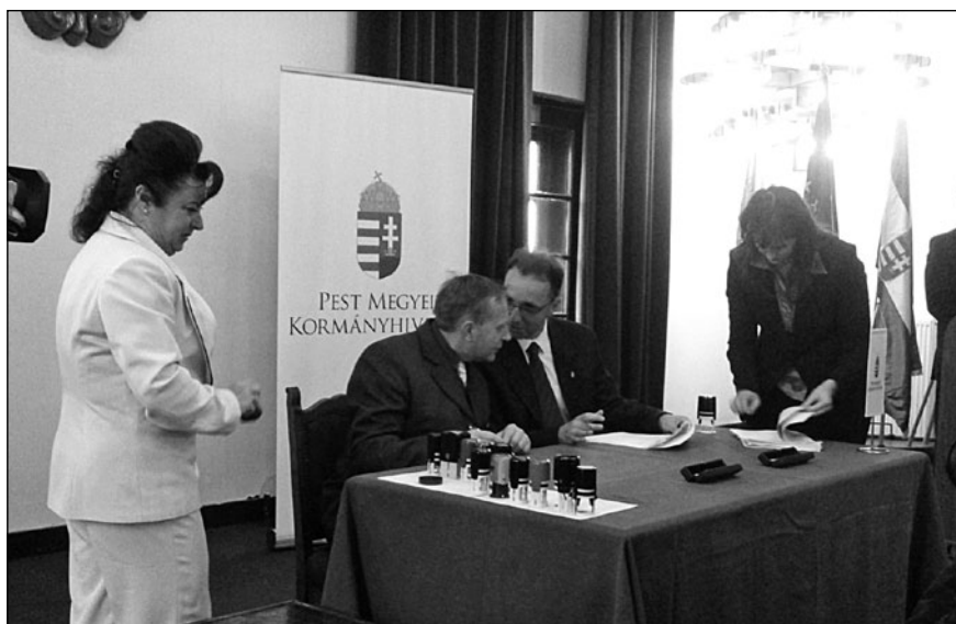
A megállapodás aláírása a Városháza Dísztermében