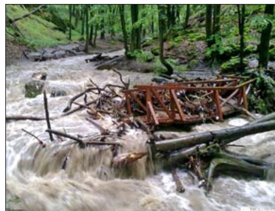
A Szurdokba vezető fahidaink egyike volt...

Nagy mennyiségű csapadék hullott vasárnapra virradó éjjel a Pilisben. A Pilisszentkereszten, Csobánkán és Pomázon átfolyó Dera patak több helyen kilépett a medréből. Pilisszentkereszten a víz elsodort egy fahidat, egy vízelvezetést segítő munkagép elsüllyedt, egy gázvezeték is megsérült, melynek következtében órákon keresztül ömlött a gáz. Csobánkán és Pomázon több lakóház is víz alá került. Vasárnap a patak visszatért a medrébe, a Helyi Védelmi Bizottság homokzsákokkal és homok helyszínre szállításával készül az esetleges újabb áradásra, amely az előrejelzések alapján valószínűsíthető. A Dera patak mentén lakók az értekeiket, állataikat biztonságba helyezték és homokzsákok készítenélbe helyezésével készülnek az újabb ár érkezésére.