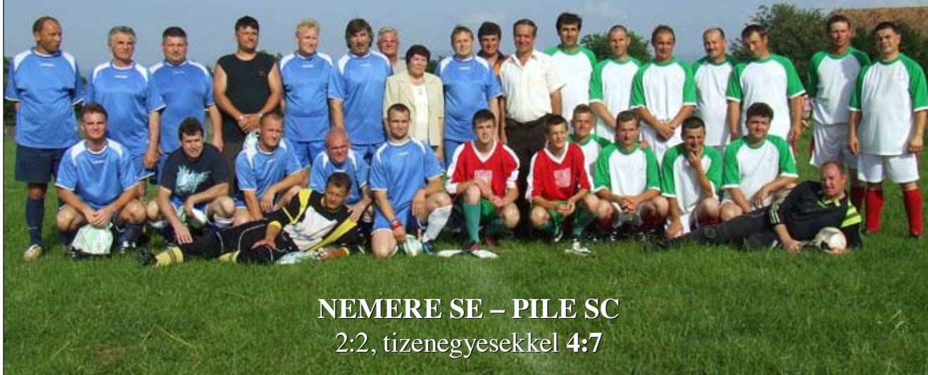
NEMERE SE – PILE SC 2:2, tizenegyesekkel 4:7

A székelyföldi Kézdiszentkereszt meghívására pilisszentkereszti labdarúgók jártak egy hosszú hétvégén testvérközségünkben, hogy összemérjék erejüket a helyi öregfiúkkal. A 2008-ban kezdődött testvérközségi kapcsolataink újabb területtel bővültek. A kultúra és a közelet szereplői után a pilisszentkereszti sportot képviselő PILE SC korosabb focistái egy-két fiatalal és légióssal megerősítve látogattak el Kézdiszentkeresztre, önkormányzatunk támogatásával. A hosszú és fárasztó utazást elfeledtette a mindig bőséges és kedves székely vendéglátás, valamint a hétvége programja. A 14 fős csapat tagjait egy-egy helyi labdarúgó családjá látta hálóvendégül, ezzel is növelve a közvetlen és családi kapcsolatok kialakulásának esélyét, a testvérközségi kapcsolatok személyes kibővülését. A szombat délelőtti rövid megemlékezés és koszorúzás a falutól 30 km-re lévő Nyerges-