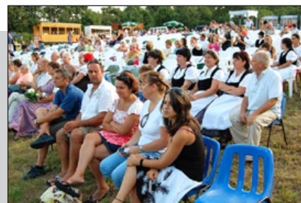
A színvonalas előadást népes közönség figyelte