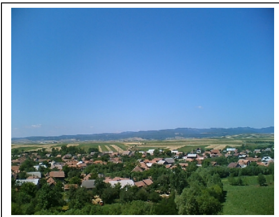
A történelmi Magyarország határai...