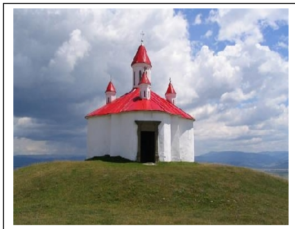
A Szent István-kápolna a Perkő tetején