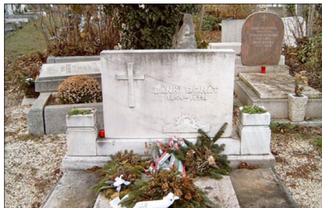
Bánki Donát sírja a Farkasréti temetőben