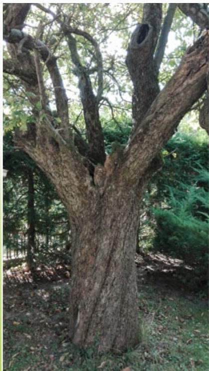
A matuzsálemi kort megelőző – a mai napig termő – pogácsaalma-fa termése húsvétkor a legfinomabb.