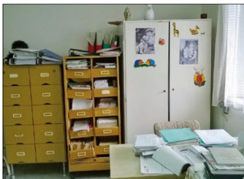
... a felújítás előtt