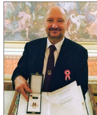
Áder János, Magyarország köztársasági elnöke