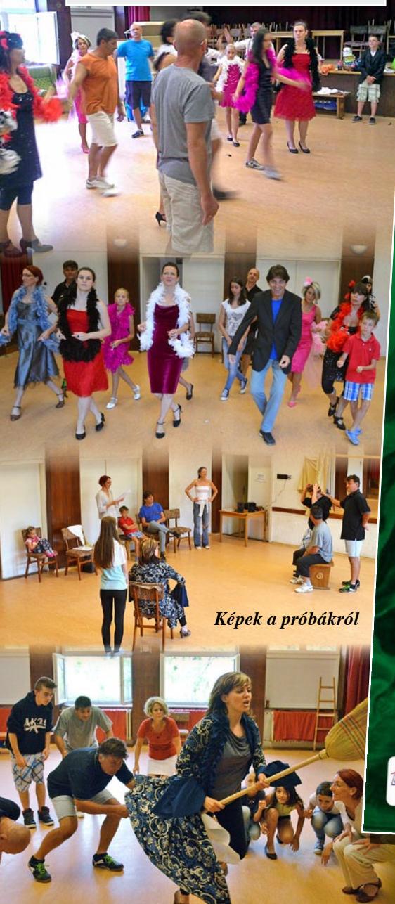
Képek a próbákról